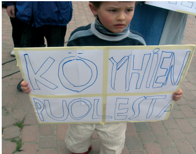
Julistus torstaina järjestetystä mielenosoituksesta.