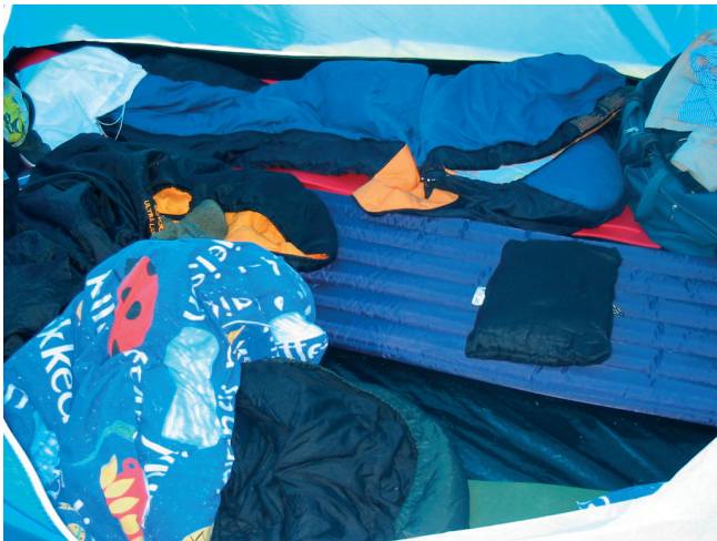
Teltta numero 19. sisustusta...

(tietysti). Tästä teltasta opimme, että teltta voi olla myös tavallinen, ei tarvitse olla kamalasti mitään luksuksia.