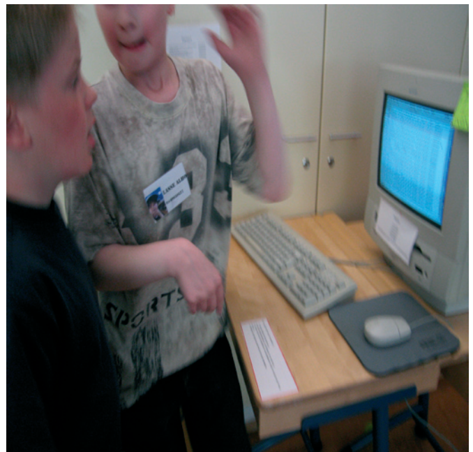
Muistakaa netti-etiketti, eli netiketti!