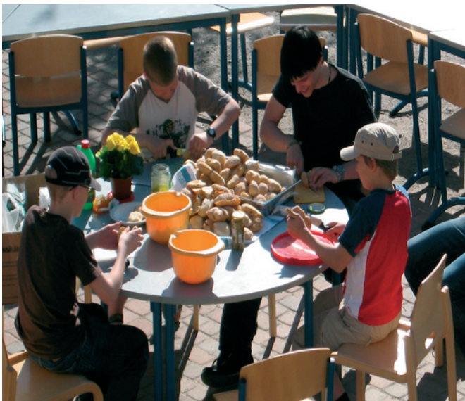
Ruokaa valmistamassa lauantaina. Mahtavat kellit sallivat ulkoruokailun.