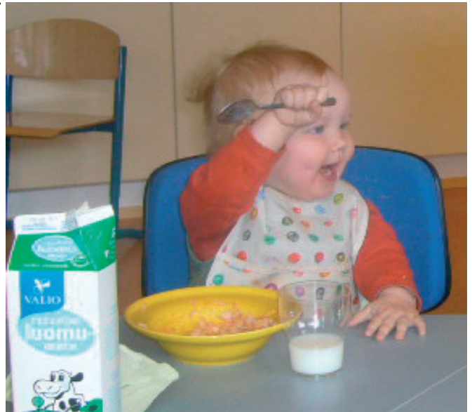
Karoliinakin on innoissaan ruokaryhmän ruuasta.